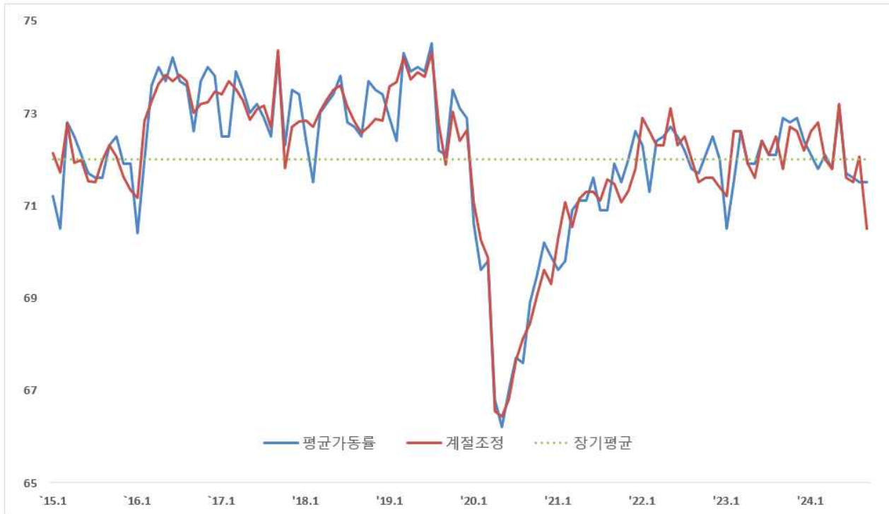
< 중소기업 평균가동률 추이 >