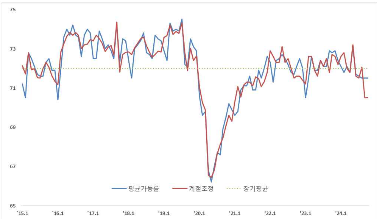
< 중소기업 평균가동률 추이 >