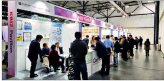
중소기업중앙회는 '제28차 세계한인경제인대회' 부대행사로 열린 한국상품박람회에 'KBIZ관'을 꾸렸다. 참가 기업들이 상담을 진행하고 있다.

특히, 전시회 기간 동안 KBIZ관 참여 25개 기업은 408건, 3200만 달러 상당의 상담을 진행했고 실제 10건의